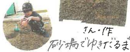
さん・作 砂・粘土でゆきだるま

3学期が始まって、早くも1ヶ月が経ちますね。春先のように暖かい日もあれば、先日は雪が降ったりと寒暖差が激しい日が続いています。子どもたちはそんな中でも