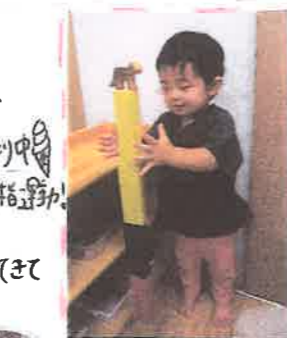
〈ニワトコ大工さん玩具〉 ちやん、親指で 押すことに成功! とがた角と角を合わせ て並べてみる ちやん 真新しいと張り替えています。