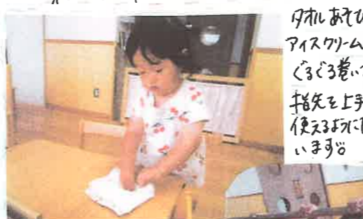
マールあそびで アイスクリム作り中 ぐるぐる巻いて手指を伸ばす 指先を上手に 使えるようになって います。