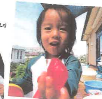
みぞ! 水の中が 見つけると ちやん