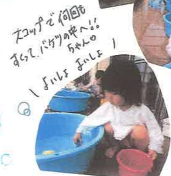
スコップを何回も 使って、シャベルの ちやん