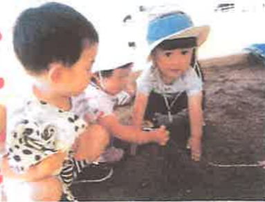
ちやんさんが 作ってくれた 砂山。 あ〜い。 ふわふわ!