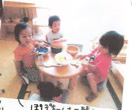
ほろちゃんも一緒に

食事の準備を済ませ、 さあ、たんぽぽぐみに来た ちやん、お友達を連れて 仲間入り! すると、自分の分を置いて、 ちやん、お友達を連れて、 ちやん、お友達を連れて、