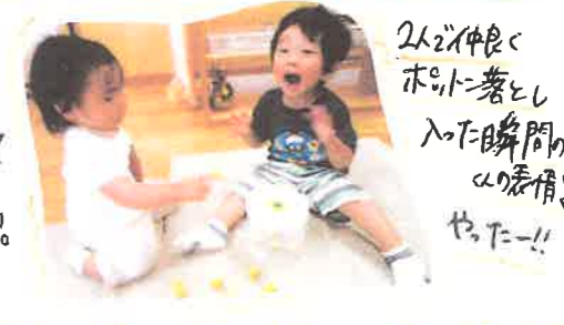
2人で仲良く ホットクッキー 入った瞬間の ちやん ちやん