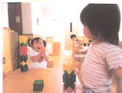
ちやんが積み木を瞬間、 パチパチ拍手の音、ステキな瞬間です。