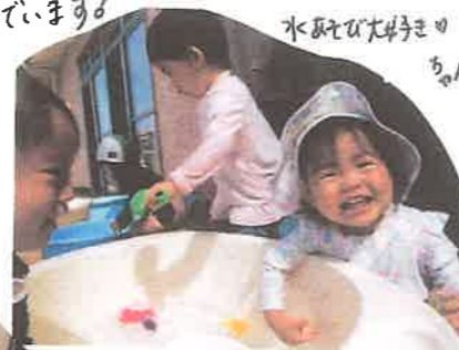
水あそび大好き ちやん