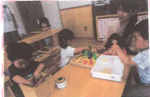
型はめ木、トランプなど、手指を伸ばすあそびを 楽しむ者がたくさん見られています。