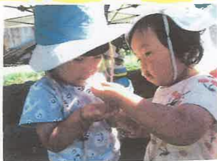
あ、! ダンゴムシ! 見つけたダンゴムシ、手のひらにのせて。 ちやんの手からちやんの手へ、と。 「おせて!」ちやん「いよ! だ〜ぞ!」