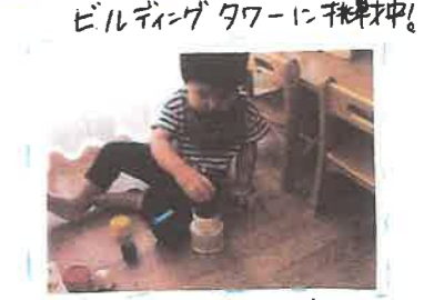
ビルディングタワーに挑戦中! 1つずつ大きさが違うビルディングタワー の中に入れて、積み木で遊んでいる 玩具です。