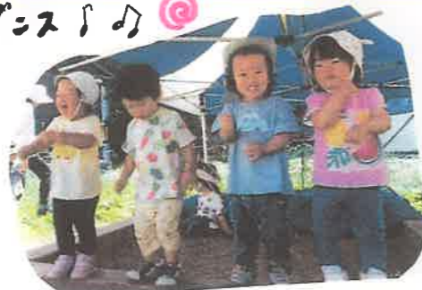
みんなが楽しそうとやってきました ちやん「ぐるぐる〜」と、4人に 踊りました! その後ちやんも参加! 5人でぐるぐるダンスを踊りました!