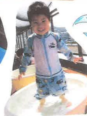
最初には足が水に入っていた 両足も入れられたよ!