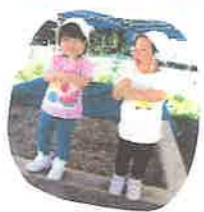
ちやんから始まった ぐるぐるダンス 最初はちやんと2人で 踊っていると...!!