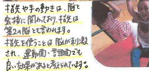
指先や手の動きは、脳と 密接に関係しており、指先は 第2の脳とも言われます。 指先を使うことは、脳が刺激 され、運動面、言語面でも 良い効果があるとされています。